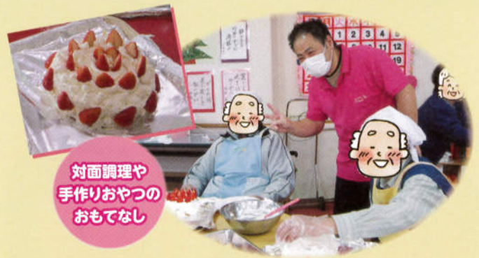
対面調理や 手作りおやつ のおもてなし

大画面で歌える楽しいカラオケタイム 季節の行事やイベントがいっぱい 音楽体操で心も体もリフレッシュ