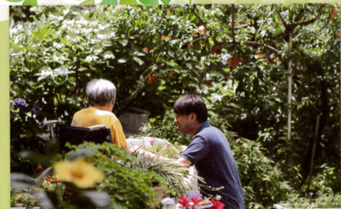
中庭では四季折々の花や実が楽しめる