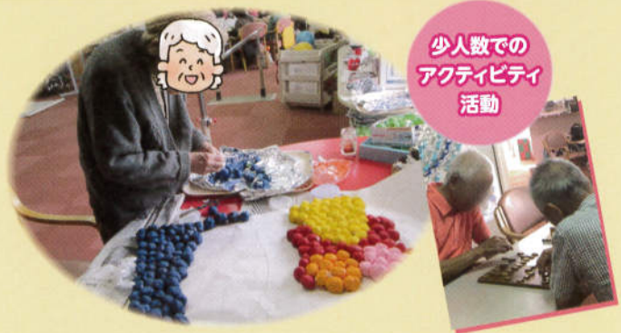
少人数での アクティビティ 活動