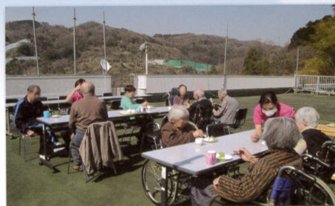
屋上で新鮮な空気や明るい陽光にふれることで、リフレッシュ効果