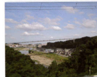
柏原の町が一望できるゆったりとしたフロア