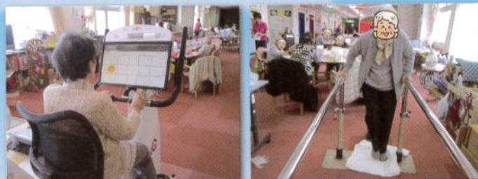
運動と脳トレを組み合わせた「コグニサイズ」で認知症を予防