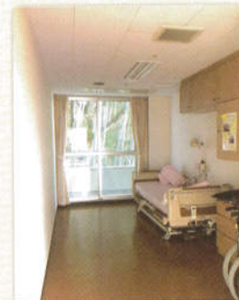
テレビ、クローゼット完備