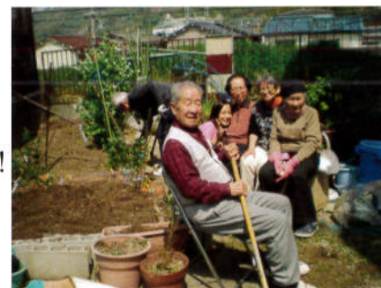
製作活動も 行っています!

デイサービスゆうちゃん柏原店では、利用者様の個人情報に関し、適正かつ適切な取り扱いに努力するとともに、個人情報に関する法令を遵守し、個人情報の保護を図ります。